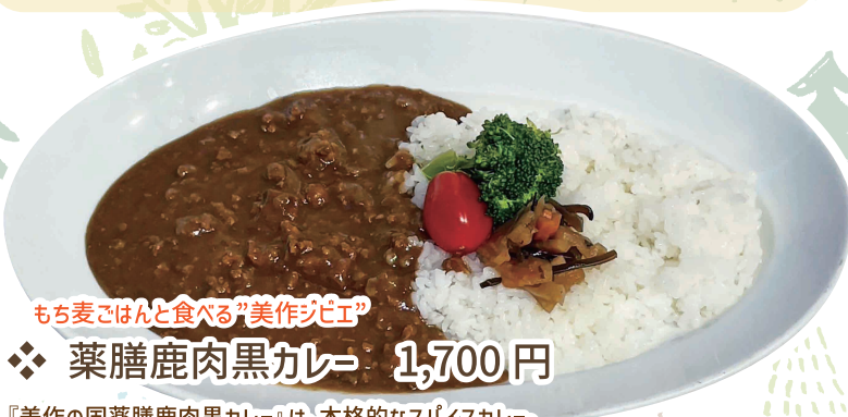
もち麦ごはんを食べる”美作ジビエ”