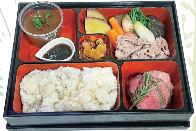
美作産もち麦をたっぷり使用♡

『美作の国薬膳鹿肉黒カレー』は、本格的なスパイスカレー。プチプチ食感のもち麦ごはんとの相性も抜群です。