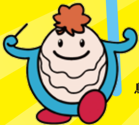
けんみん文化祭ひろしま マスコットキャラクターパンケーキ

本紙裏面にアンテナショップのレシートを貼って応募すると、とっとり旅行のほか ととりの逸品など豪華プレゼントが抽選で当たります!