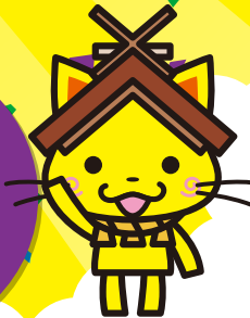
島根県観光キャラクター「しまねっこ」 島根連許諾4547号

9月19日(火)から一時休館 させていただきます予定です。 詳しくは裏面連絡先まで お問合せください。