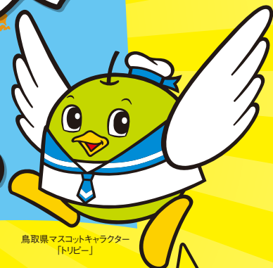
鳥取県マスコットキャラクター 「トリピー」