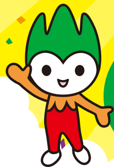
山口県 山口県PR本部長 ちよるる